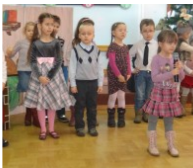
Dzień Babci i Dziadka w DPS w Ostrołęce