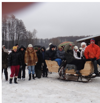
Kulig dla mieszkańców