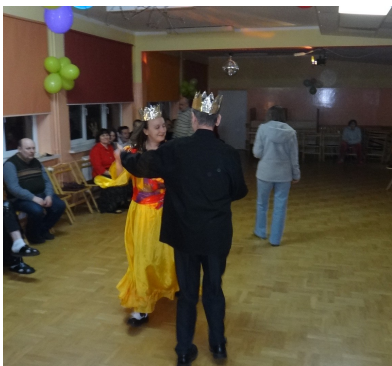
Bał karnawałowy w DPS