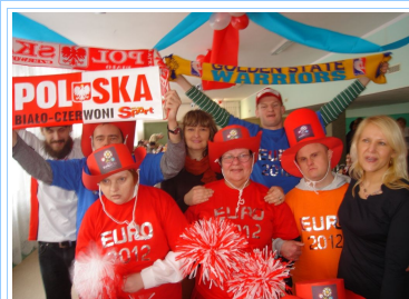
Spotkanie Środowiskowych Domów Samopomocy styczeń 2012