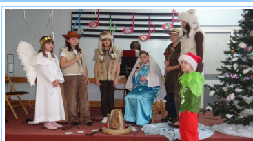
Jasełka w DPS styczeń 2012