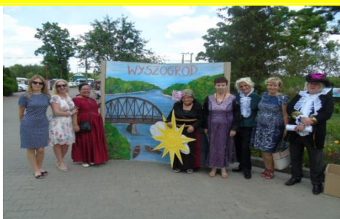
Dni Humoru i Satyry w Zakrzewie