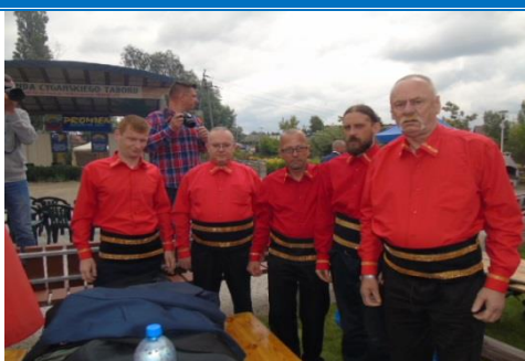
XI Festiwal Muzyki Cygańskiej – „Promień 2017”