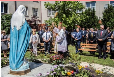
Uroczystości Obchodów Jubileuszu XX-lecia Domu Dnia Patrona oraz poświęcenia Figurki Matki Bożej