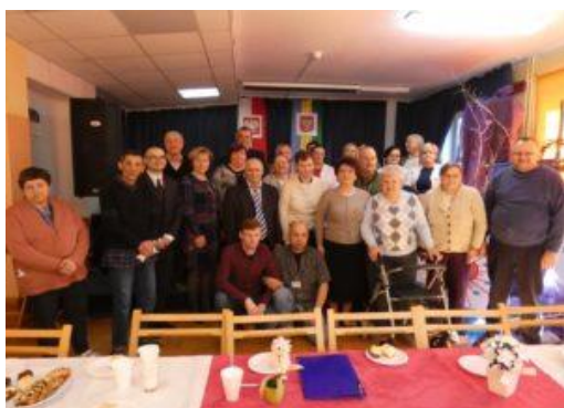
Wybory do Rady Mieszkańców Naszego Domu