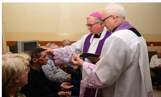
Obchody XXVI Światowego Dnia Chorego