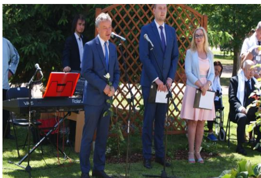
Uroczystości obchodów Dnia Patrona 2017